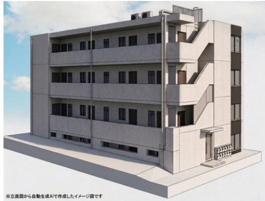
※立体図から自動生成AIで作成したイメージ図です

オートロック,モニタ付オートロック,角住戸,玄関ホール,陽当たり良好,閑静な住宅街,防犯カメラ,メールボックス