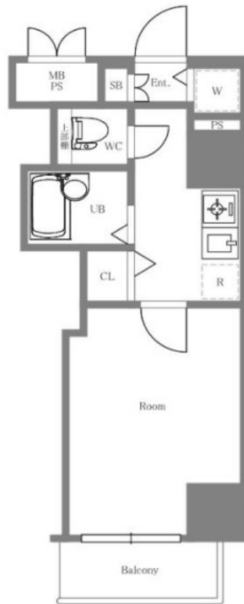
バルコニー方角：南