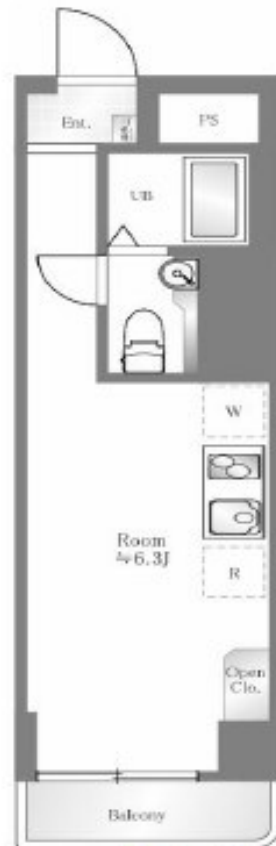
バルコニー方角：西