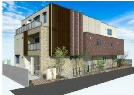
※外壁の色合いは一部変更になりますので、上記パースは参考としてご覧ください

2F以上,2面採光,オートロック,モニタ付オートロック,角住戸,玄関ホール,最上階,振り分け,陽当たり良好,閑静な住宅街,防犯カメラ,セキュリティ会社加入済