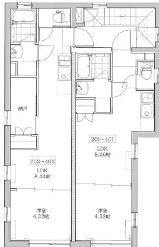
1-3F : 1LDK